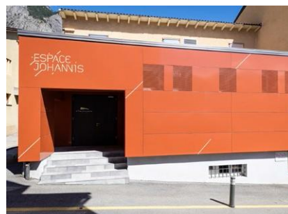
Espace Johannis (rue Plane Ville 24), Chamoson

Tous les concerts se déroulent à l'Espace Johannis, à Chamoson, à 17h.